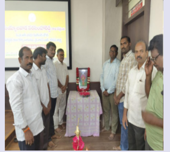
అంటే 1947 ఆగష్టు 15 వ తేదీన మన దేశానికి స్వాతంత్ర్యం లభించింది.

నేటి యువతరానికి ఆదర్శ మూర్తి, ప్రాతః స్మరణీయులు అయిన ఉయ్యాలవాడ నరసింహారెడ్డి 24-11-1806లో ఆంధ్ర ప్రదేశ్ లోని కర్నూలు జిల్లా ఉయ్యాలవాడ మండలం, రూపనగుడి గ్రామంలో జన్మించారు. ఉయ్యాలవాడ నరసింహారెడ్డి 1847 ఫిబ్రవరి 22న బ్రిటిష్ పాలనకు వ్యతిరేకంగా పోరాడి, వీరమరణం పొందిన స్వాతంత్ర్య సమరయోధుడు. ఆయన కర్నూలు జిల్లాలోని ఉయ్యాలవాడ గ్రామానికి పాలెగాడు. నరసింహారెడ్డి తనకు రావలసిన భరణాన్ని ఇవ్వకపోవడంతో బ్రిటిష్ ప్రభుత్వంపై తిరుగుబాటు చేసి, అనేక పోరాటాలు చేశాడు. 1846 అక్టోబర్ 6న బ్రిటిష్ సైన్యం ఆయనను పట్టుకుని, 1847 ఫిబ్రవరి 22న ఉరి తీశారు. నరసింహారెడ్డి మరణానంతరం 100 సంవత్సరాలకు