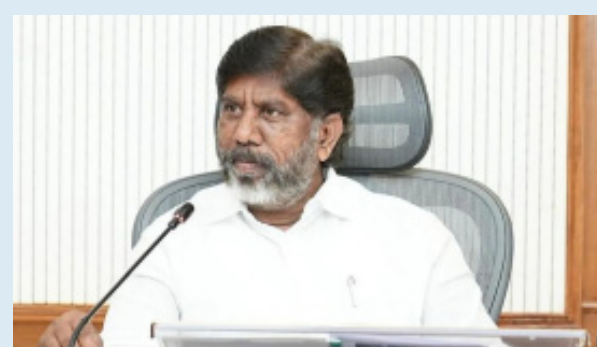
ఎలా ఉంటుందన్న ఆందోళన ప్రభుత్వ వర్గాల్లో వ్యక్తమవుతోందని సమాచారం. ఈ అంశంపై ప్రభుత్వం అధికారిక వివరణ ఇవ్వాలని అవసరం ఉందని విజ్ఞప్తులు సూచిస్తున్నాయి.